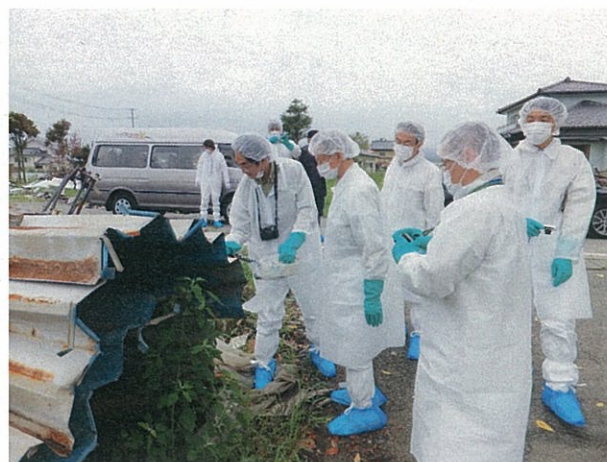
楢葉町山田浜における調査状況