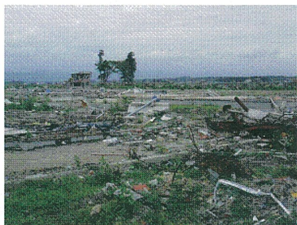
浪江町請戸における災害廃棄物の状況（左：請戸小学校、右：請戸小学校北部）