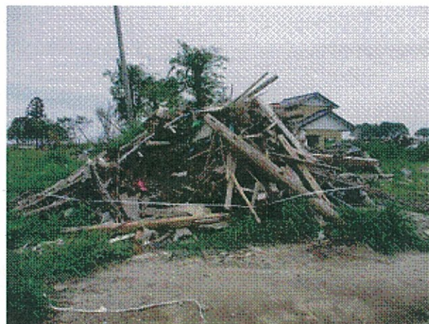
楢葉町山田浜における災害廃棄物の状況